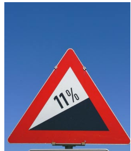
Aktives Insourcing steigert die Produktivität um mehr als 10 %.