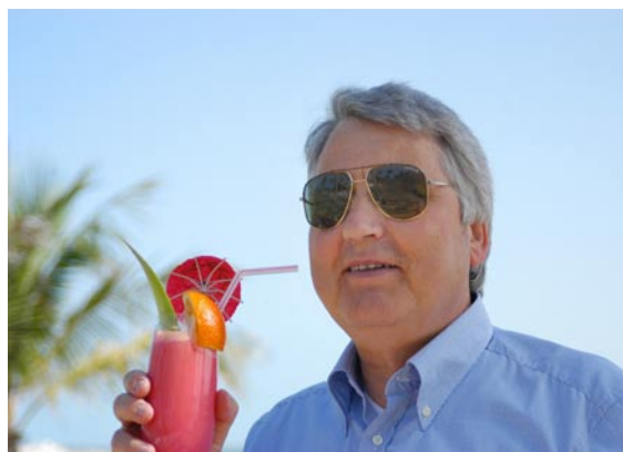
Geschäftskontakte zu so genannten „Steueroasen“ werden vom Fiskus argwöhnisch kontrolliert.

„Steuerhinterziehung“ und „Sozialleistungsbetrug“ ausgedehnt. Wer bei den Kontrollen größere Bargeldmengen mitführt, muss mit einer Kontrollmitteilung an sein Finanzamt rechnen. Zwar enthält die „schwarze Liste“ der Steueroasen im Augenblick noch keine Länderangaben, dennoch weist das Bundesfinanzministerium darauf hin, dass es in Europa noch Länder gibt, die ihre Zusagen zu konformem Verhalten erst umsetzen müssen.